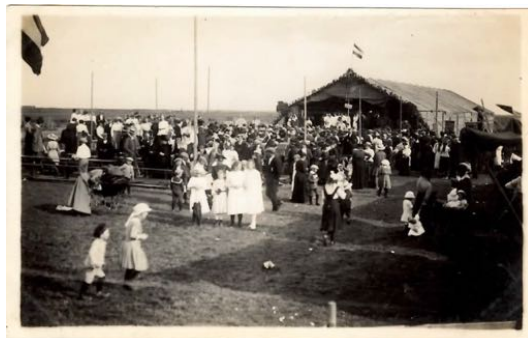
1918 – feesttent jubileum 25 jaar