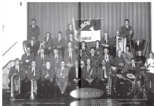
Excelsior 100 jaar

Na de oorlog werden de eerste donkerblauwe uniformen aangeschaft.