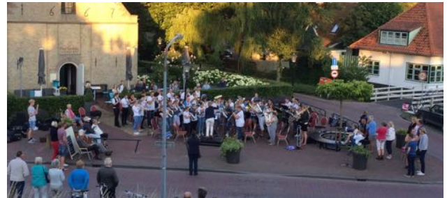
Excelsior samen met Sursum Corda 2018

van je horen' en een studieweekend (Bandcamp) behoren tot de activiteiten. Ook de jaarlijkse seizoensafsluiting op het plein voor de Buurtjeskerk (restaurant het Kerkje) hoort tot een vaste activiteit. Dit jaar hebben wij dit voor het eerst samen met Sursum Corda in tweevoud gegeven. Eerst bij het Dorpshuis het Centrum (helaas binnen i.v.m. de weersomstandigheden) en een week daarna in het zonnetje bij de Buurtjeskerk.