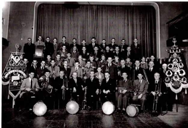
orkest in 1953

Er werd niet alleen gerepeteerd voor uitvoeringen maar ook werd meegedaan aan optochten of men organiseerde zelf een mars.